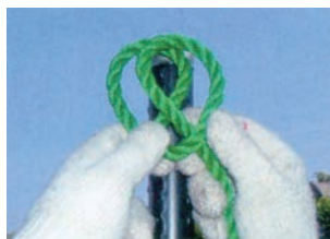
② ロープの準備 右側の輪を上重ねます。