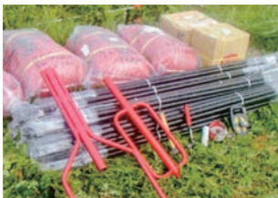
① 必要資材数量の確認 施工に必要なネット及び部材の数量を用意し運搬します。