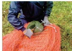
③ 吊りロープ・押さえロープの通し込み ガイドロープを利用してネットへ、吊り・押さえロープを通し込みます。