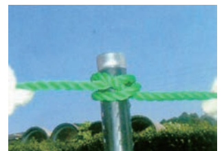
③ 支柱への固定 支柱(イボ竹、FRP支柱)に通し両側を引っ張り完了です。