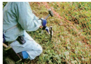
⑦ アンカーによる押さえロープの固定 上図の要領で、シャトルアンカー又はブラアンカーを押さえロープにはさみ打ち込みます。