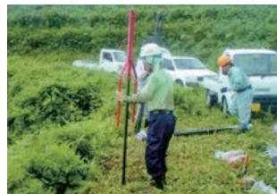
② 支柱の打ち込み 打ち込み器を使用し、支柱を打ち込みます。