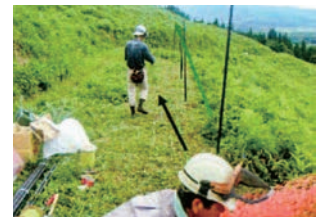
④ 布設の準備 吊りロープ、押さえロープが絡まないように約50mロープを伸ばしきります。