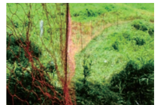
⑧ 設置状況 設置完了。