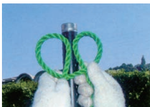
① ロープの準備 ロープにて輪を2ヶ作ります。