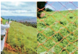
⑥ ネットの間隔の決定 ネットの目合い、支柱の間隔を見ながら支柱間のネットの間隔を決定します。設置後の目合いが正方形になるように調整します。