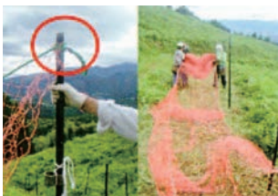
⑤ 布設開始 ネットの一端を支柱にロープの端で固定し、もう一端側のネットを引っ張って広げます。