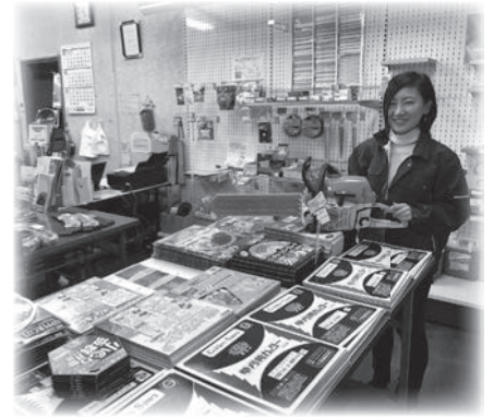
ご来店お待ちしております