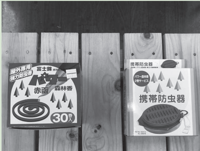
森林香 パワー 赤函 野外専用 強力防虫香