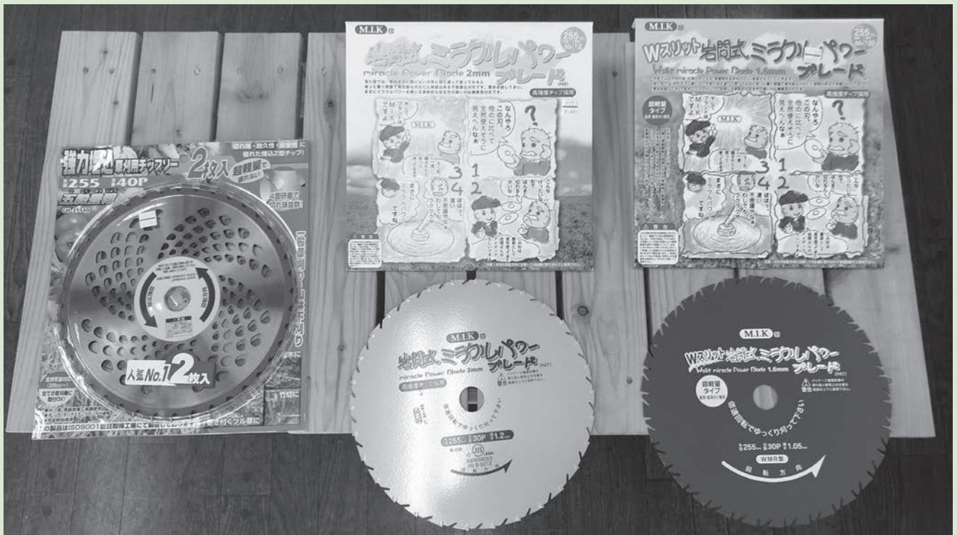
強力埋込 草刈用チップソー (2枚入) 4面研磨で切れ味抜群