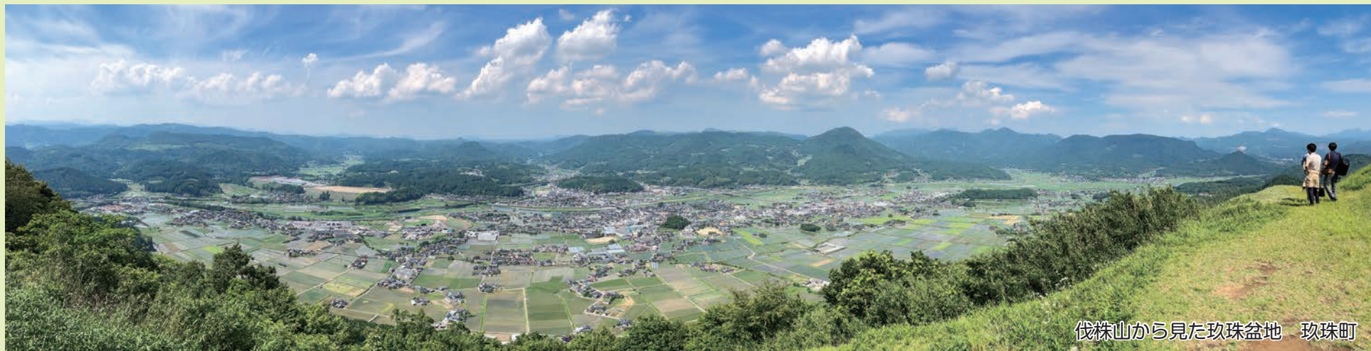
伐株山から見た玖珠盆地 玖珠町