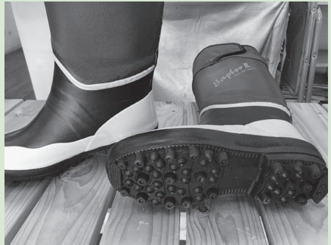
サブライⅡ 長靴 スパイク付き