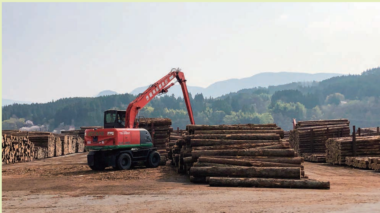
玖珠郡森林組合木材共販所